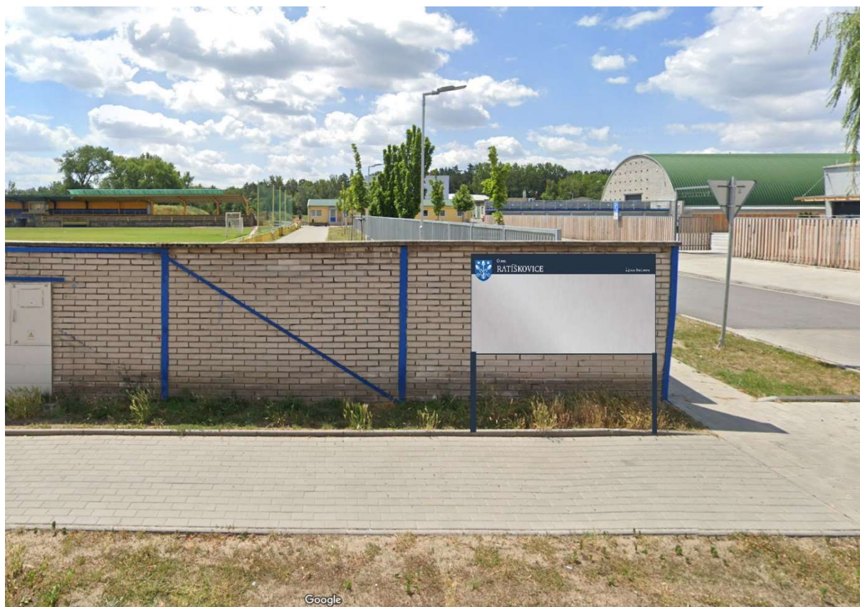
f. U pekárny ul. Rohatecká (nová plocha)